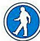
Vía obligatoria para peatones