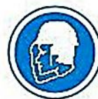
Protección de la cara