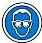
Protección de la vista