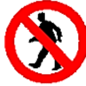
Prohibido pasar a los peatones