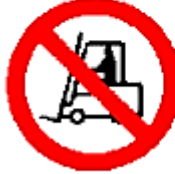
Prohibido a los vehículos de manutención