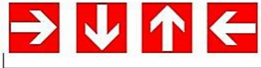
Dirección que debe seguirse (señal indicativa adicional a las anteriores)