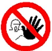
Entrada prohibida a personas no autorizadas