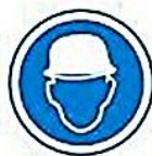
Protección de la cabeza