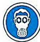
Protección vías respiratorias