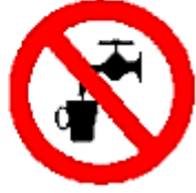
Agua no potable