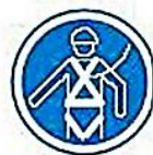
Protección contra caídas