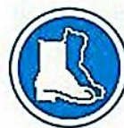
Protección de los pies