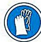
Protección de las manos