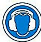
Protección del oído