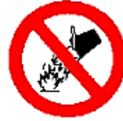
Prohibido apagar con agua