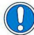
Obligación general (acompañada, si procede, de una señal adicional)