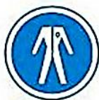
Protección del cuerpo