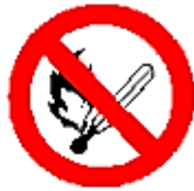
Prohibido fumar y encender fuego